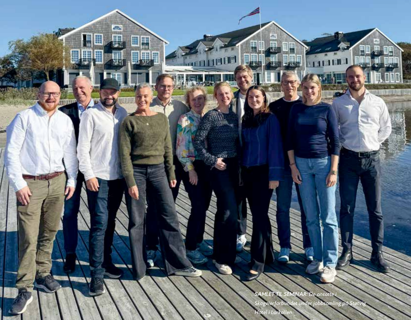
SAMLET TIL SEMINAR: De ansatte i Skogeierforbundet under jobbsamling på Støtving Hotel i Larkollen.